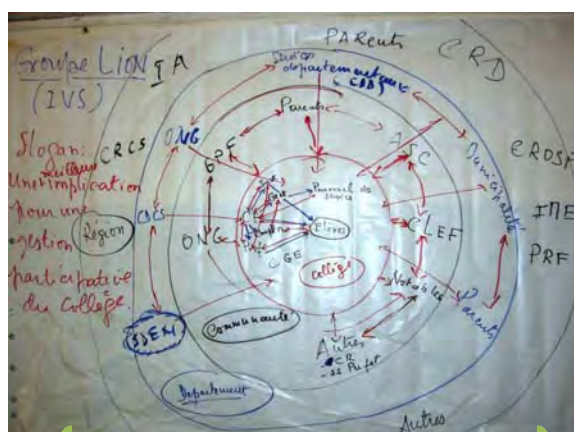
Modèle de description des différents acteurs et partenaires intervenant dans un collège

Les acteurs et partenaires ne sont pas décrits de manière mécanique, car les interactions entre les acteurs déterminent leurs co-relations et les niveaux de responsabilité qui profèrent le statut d'acteurs directs selon qu'ils sont proches de l'action ou indirects selon qu'ils sont touchés de manière indirecte. Ainsi différents types d'acteurs et de partenaires soutiennent l'école en faveur des «actions de qualité pour des élèves qui excellent.»