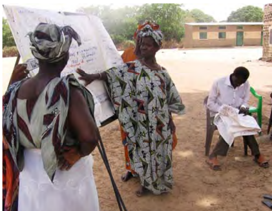
Des membres d'un « penc » exposent leur vision d'un collège de qualité