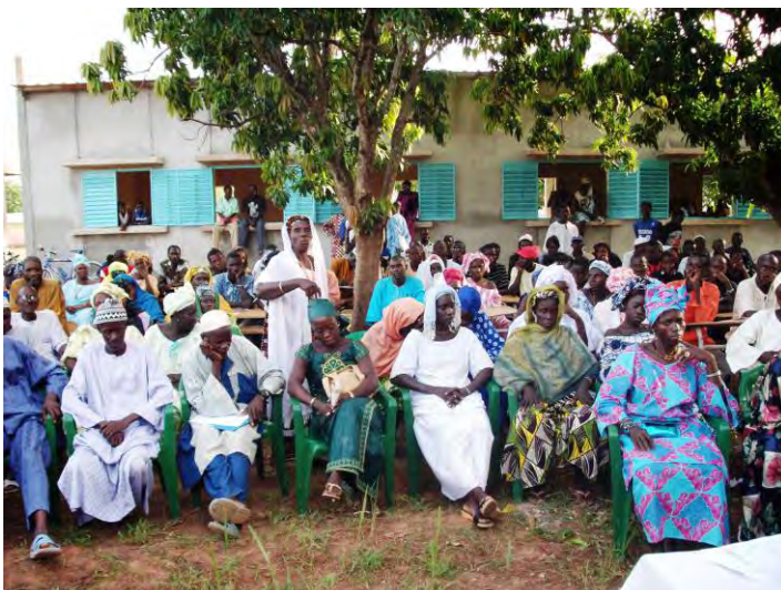
Le forum communautaire autour des problèmes du collège

Le forum est une réunion publique impliquant l'ensemble des membres de la communauté sur un sujet, un thème donné. Dans le cadre de la mobilisation communautaire, c'est un outil très prisé par les communautés chaque fois que des informations doivent être livrées ou, des discussions sont souhaitées entre les franges de la communauté.