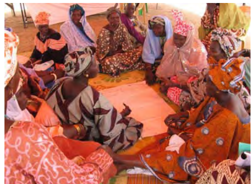
Des membres d'un « penc » autour d'une natte