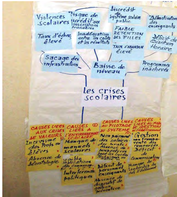
Exemple type d'arbres simplifiés

Dans le cadre du choix des solutions à mettre en œuvre, il est intéressant de faire réaliser, en complément par le groupe, un schéma pour faire ressortir les facteurs favorables ou non dans le cadre de la résolution des problèmes.