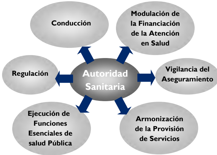
Figura 1: Las tareas de la rectoría sectorial sanitaria por parte de la Autoridad Sanitaria. (Modelo OPS-Funciones Esenciales de la Salud Pública)

En dicho modelo, la preocupación principal es la separación de funciones del sistema de salud: rectoría, financiamiento, aseguramiento, compra y prestación de servicios. Bajo esta separación de funciones se considera importante fortalecer la autoridad sanitaria nacional para que desempeñe la rectoría del sistema (OPS 2002; OPS 1997). Al inicio de