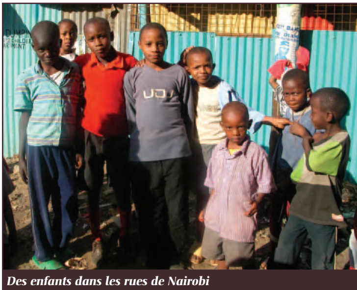
Des enfants dans les rues de Nairobi