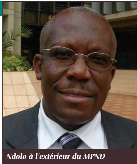
Ndolo à l'extérieur du MPND

The Capacity Project IntraHealth International, Inc. 6340 Quadrangle Drive Suite 200 Chapel Hill, NC 27517 Tel. (919) 313-9100 Fax (919) 313-9108 info@capacityproject.org www.capacityproject.org