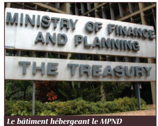
Le bâtiment hébergeant le MPND