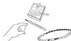
Méthodes de sensibilisation à la fertilité