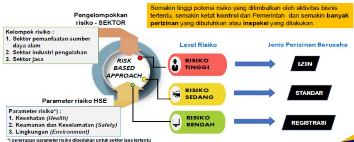
Gambar 2. Perizinan Berbasis Risiko