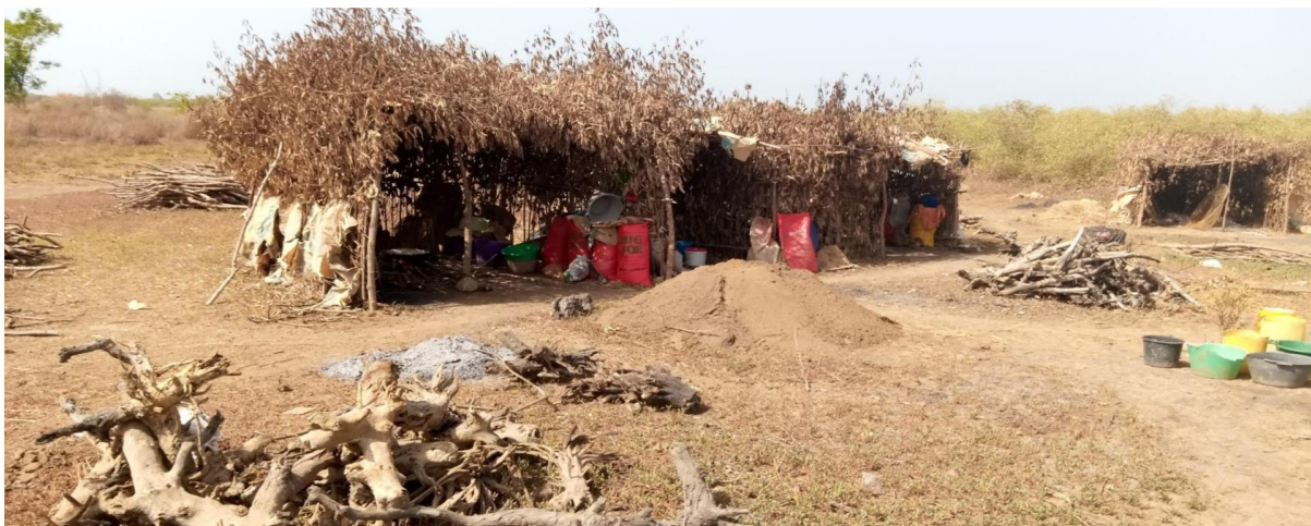
Photo A.1 : Centre de transformation des mollusques et crustacés de la communauté de João Landim.