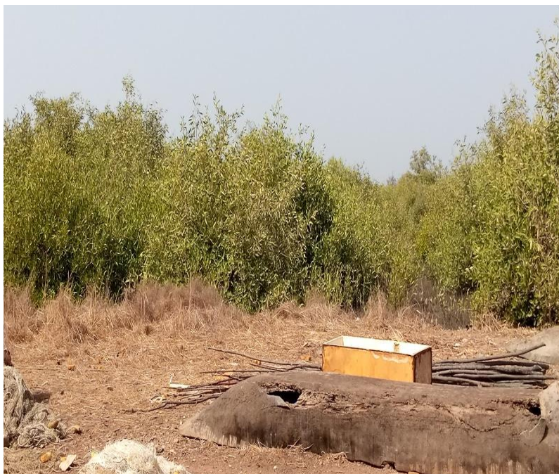
Photo A.3. Pirogues utilisées pour la récolte de mollusques et crustacés dans la collectivité de Cacheu.