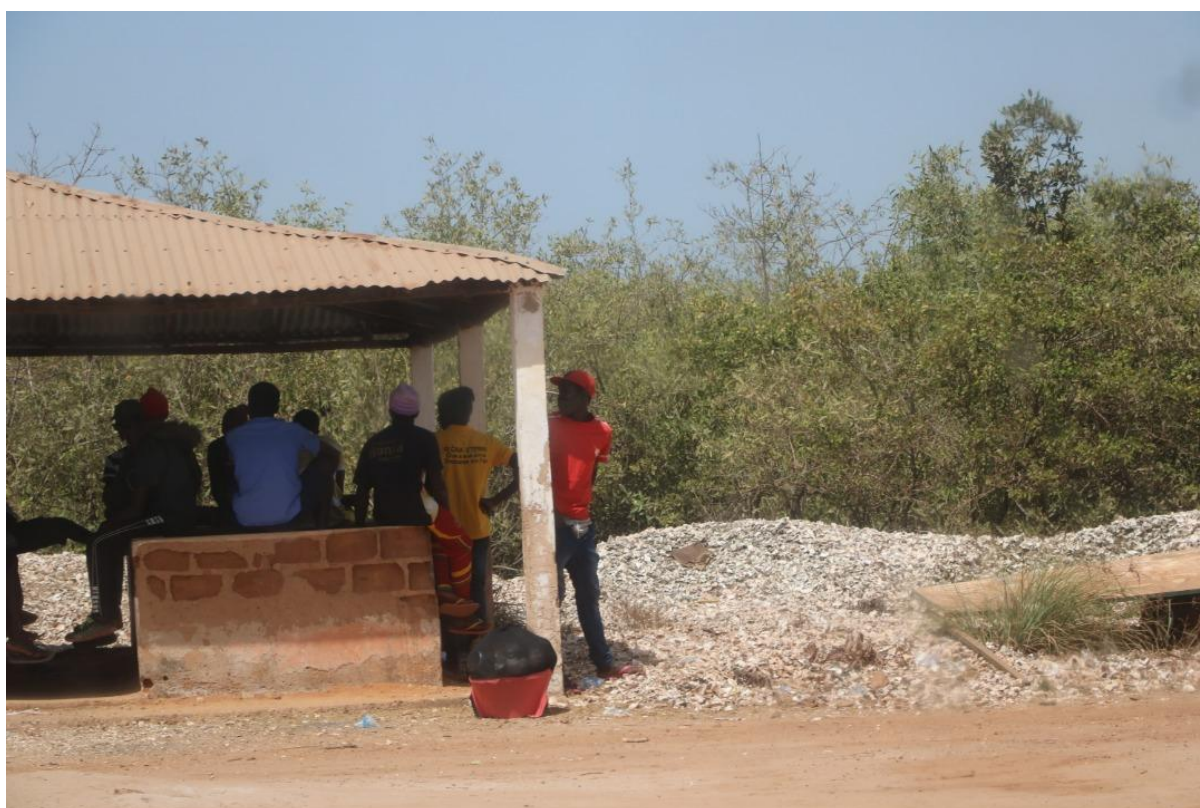
Photo A.2. Les hommes attendent d'aider les femmes à transporter leurs mollusques et crustacés dans la communauté de Cafine.