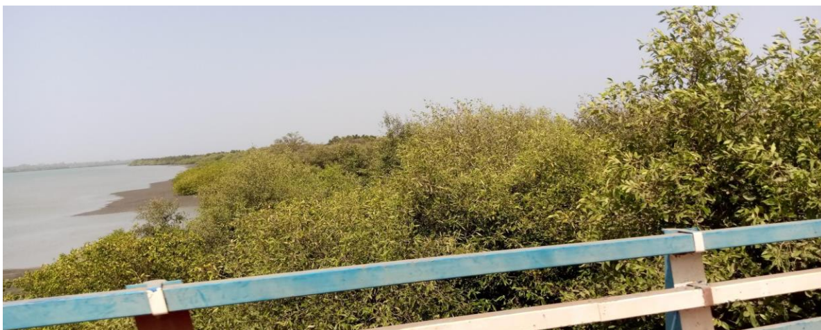
Photo A.4. Mangroves bordant un site de récolte mollusques et crustacés dans la communauté de Cacheu.