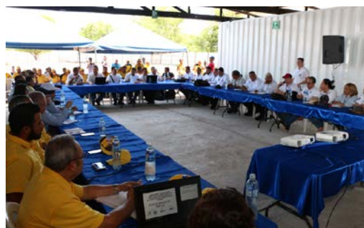
Foto: reunión en puesto fronterizo El Amatillo, con ambos Comités de Gestión de Tráfico.

Adicionalmente, se realizó una reunión con ambos Comités, FOMILENIO II y el Proyecto TFB en el puesto fronterizo El Amatillo con el objetivo de reconocer in situ el lugar en donde se realizarían las obras civiles. Finalmente, para reforzar la conferencia a distancia en donde se presentó el PGT al Comité de Honduras, y por solicitud de la SDE, el Proyecto de USAID gestionó que FOMILENIO II realizara una nueva presentación en Tegucigalpa, Honduras 4 . Más detalles sobre estas reuniones pueden encontrarse en el Anexo B de este documento.