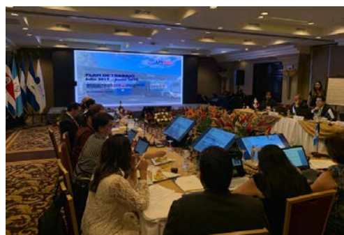
Foto: socialización de PGT durante reunión de Integración Económica.

El Proyecto TFB también socializó el PGT en la Ciudad de Guatemala, Guatemala durante una reunión de Integración Económica que fue celebrada el 27 de junio de 2019. Durante esta reunión participaron los Ministros de Economía de Centroamérica, así como personal de la Secretaría de Integración Económica Centroamericana (SIECA).