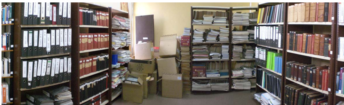
4. Library's collection at the National Public Prosecution Authority (NPPA).

In practice, the space is not available for use by NPPA staff or the public and is not presently functioning as a library. While the room still contains the shelves, books, and other materials, it is being used by 5–6 NPPA staff who are working on criminal records databases. Their workspace completely blocks access to the book area; to examine the books, the furniture used by that staff must first be moved.