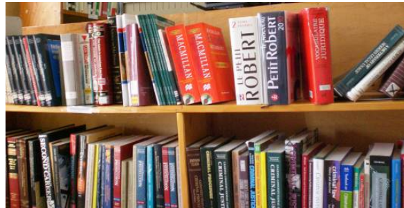
3. (From top left:) Uncatalogued newer acquisitions, digital holdings, and reference materials (ILPD).