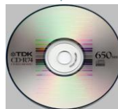
The electronic files are turned into .PDFa (PDF archive) will be burnt on DVDs for preservation.