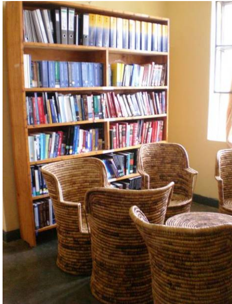
2. Reading area (ILPD).