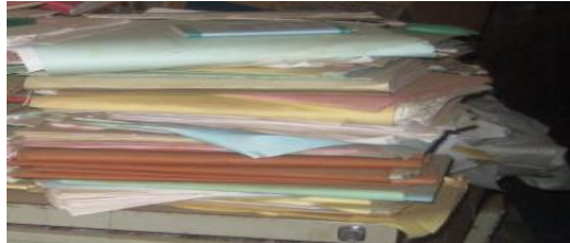
Archive documents in containers and archive rooms.