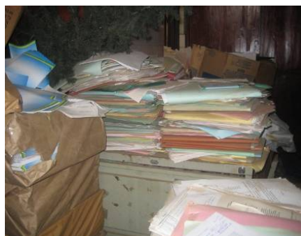
1. Minijust's Archives

The Librarian is also responsible for the Ministry's archives. She has written a draft "Methodology and Work Plan for Organizing the Minijust Archives," (see Attachment 8) which sets out a coherent plan for organizing, digitizing, and maintaining the archives. The archives are stored in two (leaky) 40-foot storage containers behind the Ministry's building and two disorganized storage rooms (see photo). At least one of the storage containers contains some books. Attempting to assess what could or should be archived was considered to be beyond the scope of this assessment, particularly because it was not possible to gain entry into the locked containers.