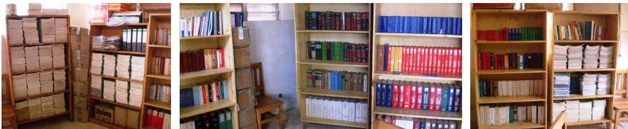
5. Kigali Bar Association's Book Room.

The KBA President ( Bâtonnier ) has a clear vision of what he would like the Library to be. The library is intended to provide resources and support for lawyers, judges, law students, and legal aid services (including indigent persons), for the purposes of research, preparing for bar admission or examinations, and continuing legal education. The KBA would like to have a library filled with up-to-date and relevant legal books, treatises, statutes, and other resources.