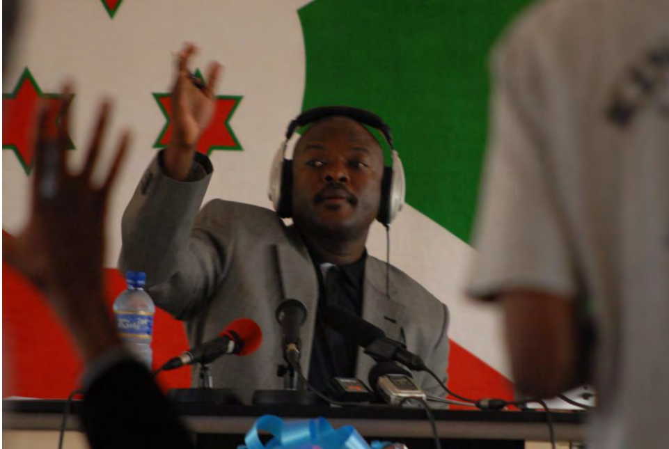
President Nkurunziza answering questions at a presidential press conference held in Gitega following the governmental retreat

Definition: Establish and/or develop a broadly functioning independent media sector, which is a crucial factor in democratic governance. Building this sector is accomplished through such activities as providing infrastructure and equipment to ensure access to information, shaping the media legal and regulatory environment, boosting professional capacity of the media sector, promoting sustainability through encouraging media-related business development and sound financial/management practices, and supporting advocacy and networking among media sector organizations.