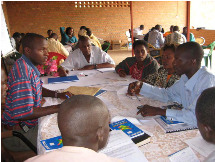
Focus group members in Cankuzo discuss land reform

meet in provincial capitals. These groups were comprised of provincial governors, communal administrators, representatives of the courts, and other elected officials. In addition, citizen and civil society representatives were invited. To ensure gender parity in the groups, we required that at least two delegates from each commune be women. In total, more than 700 people participated in the focus groups.