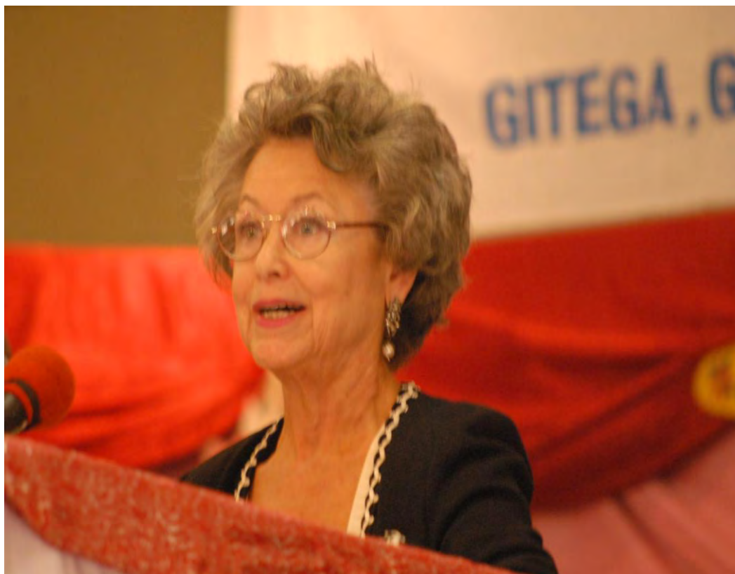
Madame Patricia Moller, Ambassadeur des Etats-Unis prononçant son discours de circonstance.

Elle a souligné que cela est évidemment lié en partie aux efforts des bailleurs de fonds qui ont pris l'engagement d'accorder plus de $650 millions en appui au plan d'actions prioritaires du Gouvernement.