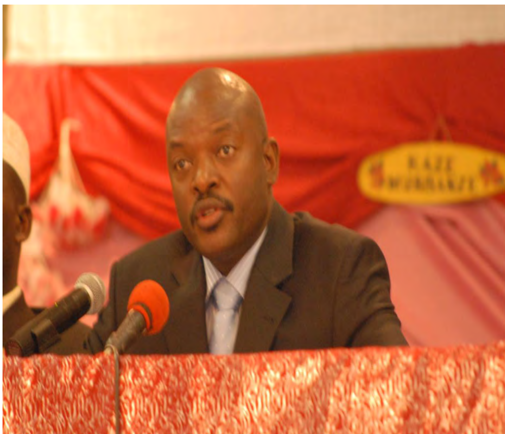
S.E. le Président procédant à l'ouverture de la retraite gouvernementale.

Il a poursuivi son discours en indiquant le pourquoi de faire une retraite gouvernementale maintenant : « Périodiquement, le Gouvernement du Burundi a choisi des moments privilégiés, en vue de recentrer son action et améliorer ainsi sa vision et ses prestations visant l'affermissement de la paix, la concorde sociale et le développement durable du pays par un travail bien pensé, bien exécuté et bien évalué. Aujourd'hui, nous sommes réunis à un moment particulier : trois ans après le jour où le peuple burundais nous a témoigné sa confiance pour conduire ses destinées ».