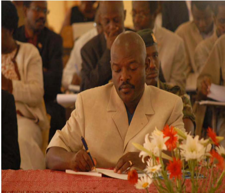
S.E. le Président de la République suivant attentivement la communication.