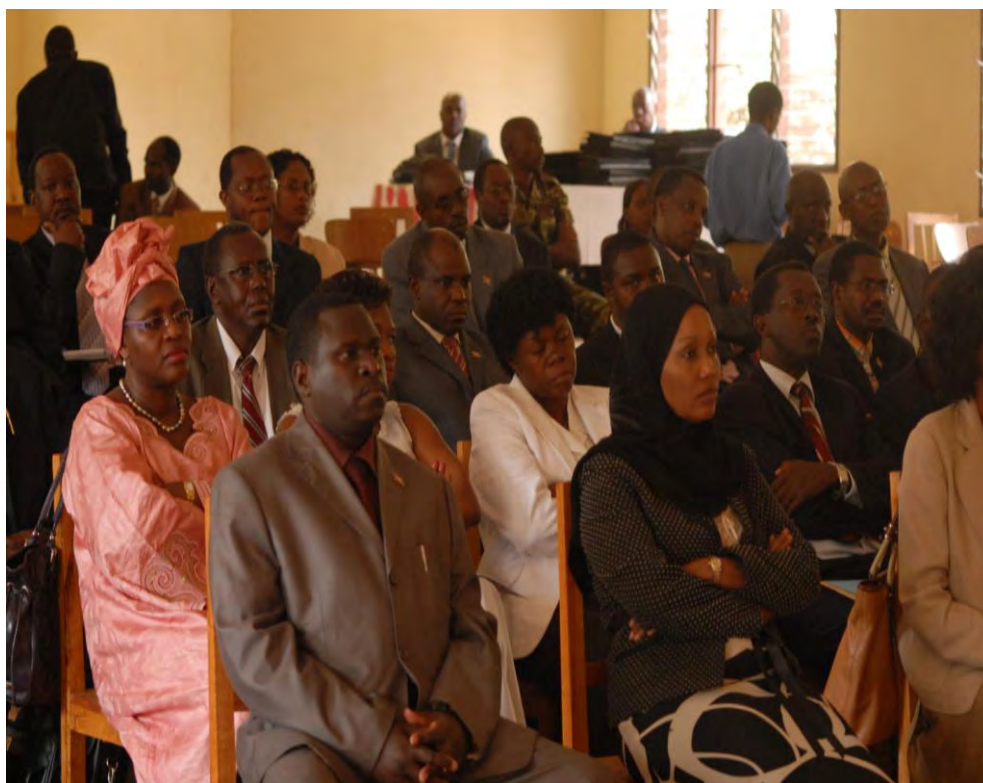
Les Membres du Gouvernement suivant les discours d'ouverture de la retraite.

Enfin, devait-elle conclure : « Cette retraite vous offre aujourd'hui l'opportunité d'initier un processus qui peut aider à trouver des solutions à tout au moins 4 importantes questions qui affectent l'avenir de beaucoup de personnes dans ce pays, dans les domaines de la jouissance d'un droit de propriété d'une terre, des droits de succession pour les femmes, de la prévention contre la corruption, le secteur économique et l'équité sociale. Indiscutablement, ces domaines génèrent des problèmes décourageants, mais en même temps, c'est vous qui aviez le pouvoir, la prévoyance et le mandat de votre peuple pour impulser un changement positif ».