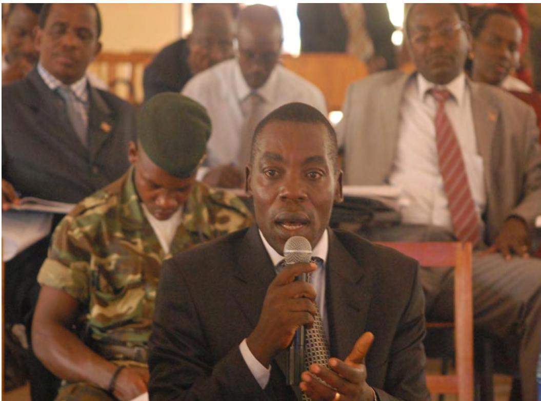
Second Vice-president of Burundi speaking during the governmental retreat session on economics, privatization and regional integration

The government retreat was the first opportunity for the entire Executive branch to discuss policy making and their roles and responsibilities vis-à-vis the people of Burundi. Several recommendations came out of the governmental retreat. Some of the principal recommendations were: adoption of the revised land code, implementation of new strategies to prevent and fight corruption, and implementation of a new executive branch communications strategy to provide quarterly updates to the public on progress towards improvement of social services and regional economic integration. Follow up on these activities has already begun. In addition, the government wishes to hold a retreat annually.