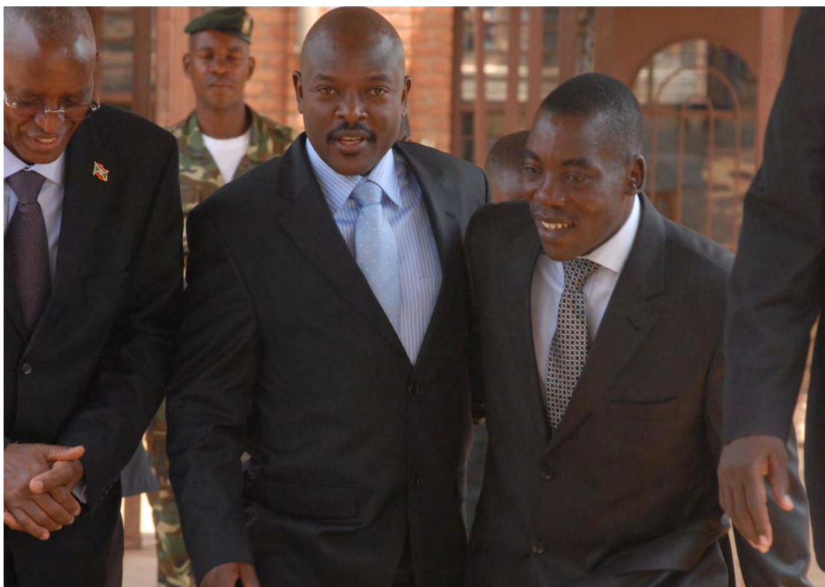
S.E. le Président Nkurunziza Pierre arrive au Grand Séminaire Jean Paul II, entouré par le Premier et le Deuxième Vice-président de la République.