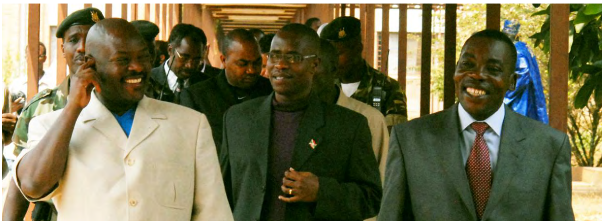
S.E. le Président Nkurunziza Pierre au Grand Séminaire Jean Paul II, en compagnie du Deuxième Vice-président de la République et le Ministre en charge de la Bonne Gouvernance.

Quelques Ministres n'ont pas pu participer à cet événement, car se trouvant en mission à l'extérieur du pays. Il s'agit du Ministre de l'Éducation Nationale et de la Recherche Scientifique, du Ministre de l'Intégration Régionale, du Vice-ministre chargé de l'Enseignement de base et secondaire.