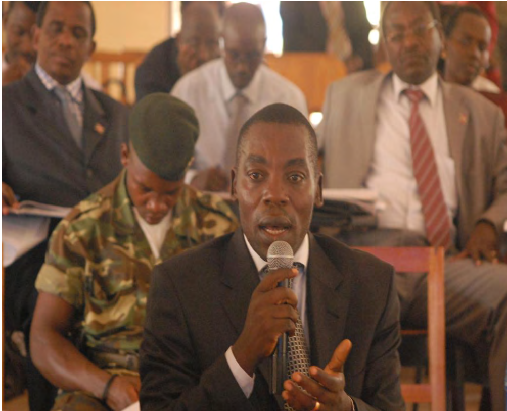
Le Deuxième Vice-président de la République intervenant sur les questions économiques, la privatisation et l'intégration régionale.

Chacun devrait, en ce qui le concerne, a-t-il poursuivi, faire un chronogramme, voir si d'ici-là on pourra atteindre les résultats attendus.